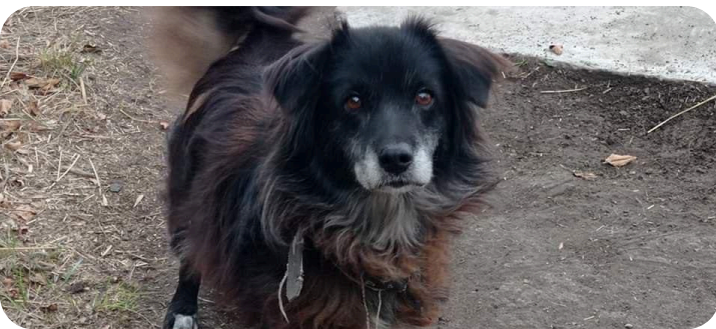
Старенька собака Жужа з Донеччини